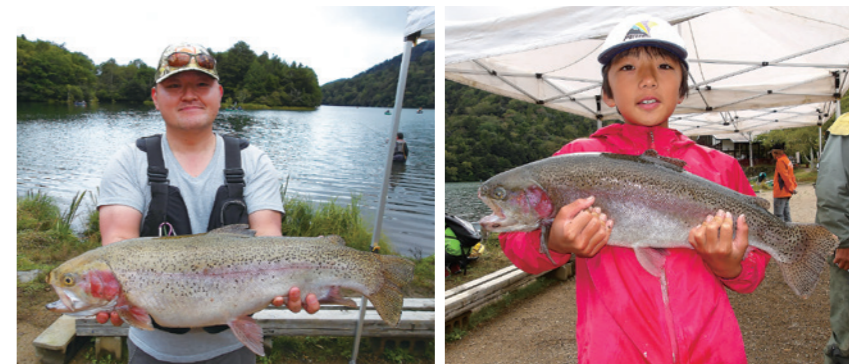
ニジマスの部優勝者と（左）キッズ賞優勝者（右）

9月23日、「ファイナルトラウトフィッシングフェスタ」を行いました。天気は曇りで釣り日和となり、大勢の釣り人が参加され、ニジマスの部の優勝は71・2cmがルアーで釣れました。ヒメマスの部は34・5cmの優勝に続き、夏の大会には釣れなかった30cmを超える大型で5位までが出揃いました。12時からの検量時間が始まってから、舟釣りの小学生に大物が掛り、30分の激闘の末、ようやく釣り上げたニジマスは、65・0cmと大物でした。13時までの登録時間に無事に間に合い、見事キッズの部で優勝を飾りました。