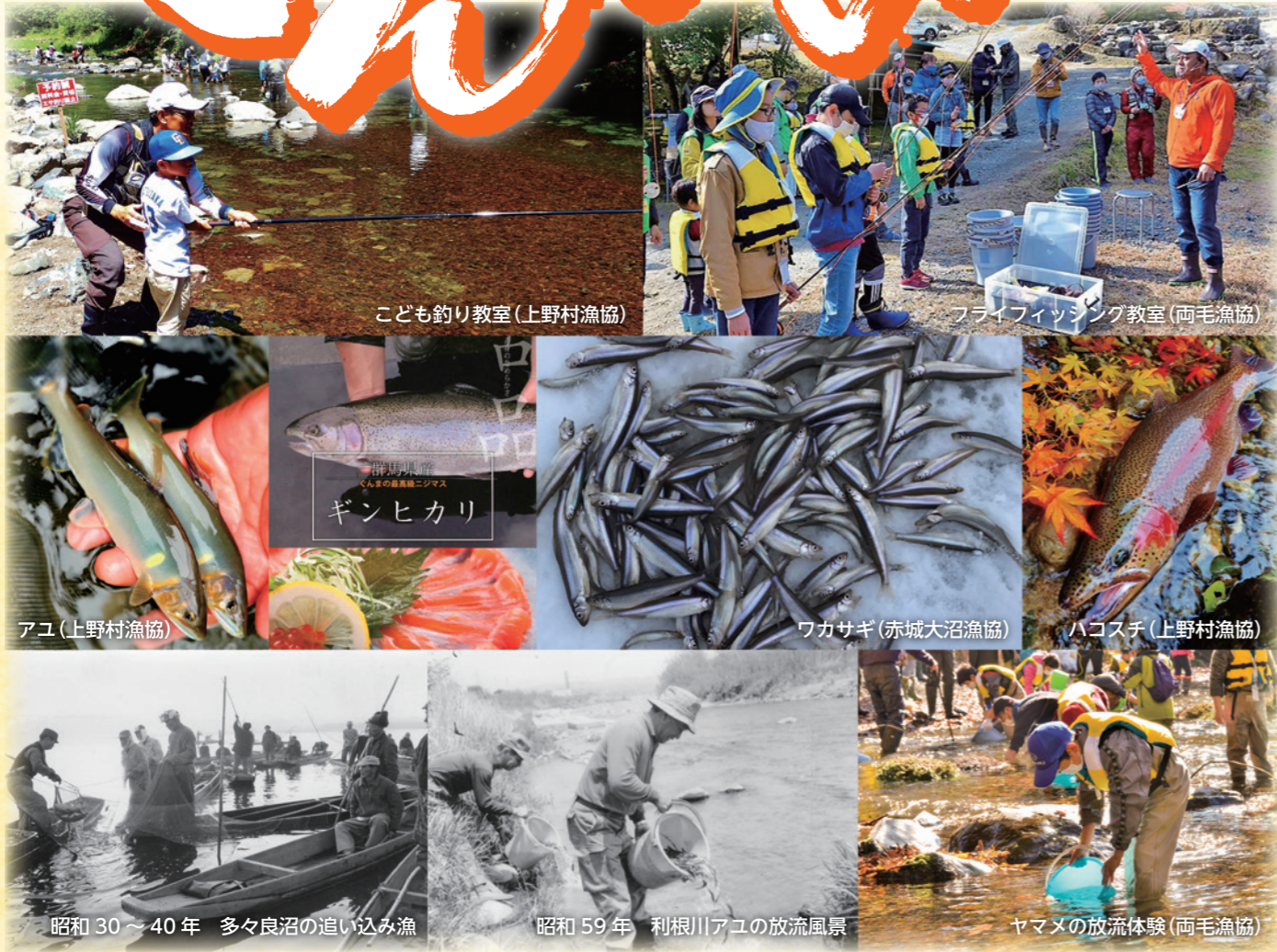
こども釣り教室(上野村漁協)