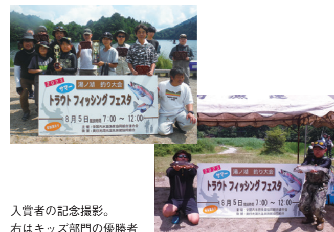
入賞者の記念撮影。右はキッズ部門の優勝者

湯ノ湖では、湯ノ湖で釣り上げたマスを自ら捌いて、炭火で塩焼きにして食べる体験スペースを事務所敷地内に整備しています。コロナ禍でしばらく中断していましたが、今年度は再開し、体験を行った夏休みの家族連れの皆様からは、良い思い出になったとの声をいただきました。