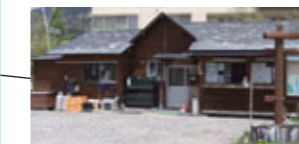
釣り券発売所 全国内水面漁連 湯の湖釣り事務所